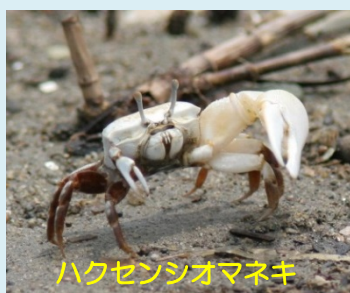
ハクセンシオマネキ