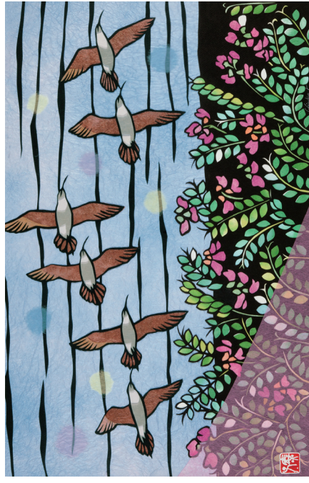
きりえ／春の海辺（チヨウシヤクシキギ）