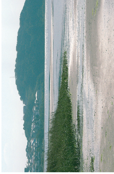
自然海岸の残る干潟として「にほんの里100選」に選ばれた和白干潟

会の活動は、会費・助成金・カンパ（寄付）などによって財政的に支えられています。自然保護にご理解のある皆様のご協力をよろしくお願い致します。