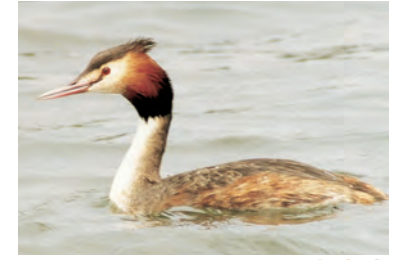
カンムリカイツブリ ●●●