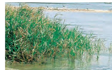
アシ (ヨシ) ●●●●