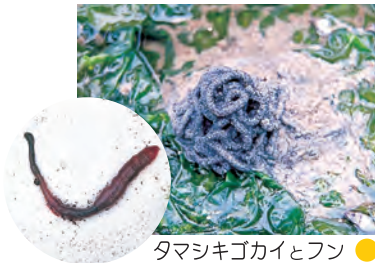
タマシキゴカイとフン ●