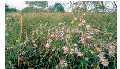
ウラギク (ハマシオン) ●