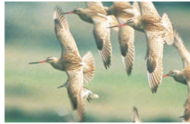
オオソリハシシギ ●●