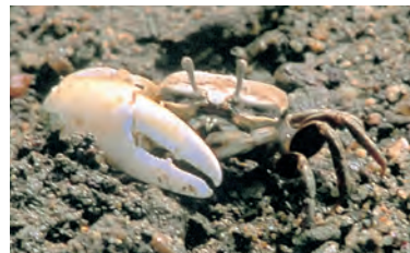
ハクセンシオマネキ ●●