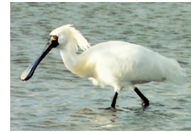
クロツラヘラサギ ●●